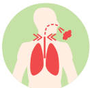
Tos perruna, voz ronca, pitidos y dificultad al respirar