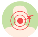
Hinchazón de párpados, labios o garganta